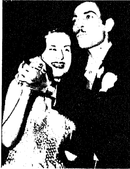
رياض غالى يراقص الأميرة فتحية في إحدى الحفلات الخاصة قبل زواجها عام ١٩٥٠